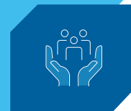
Condición de pobreza