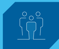
Jóvenes (18 a 28 años)